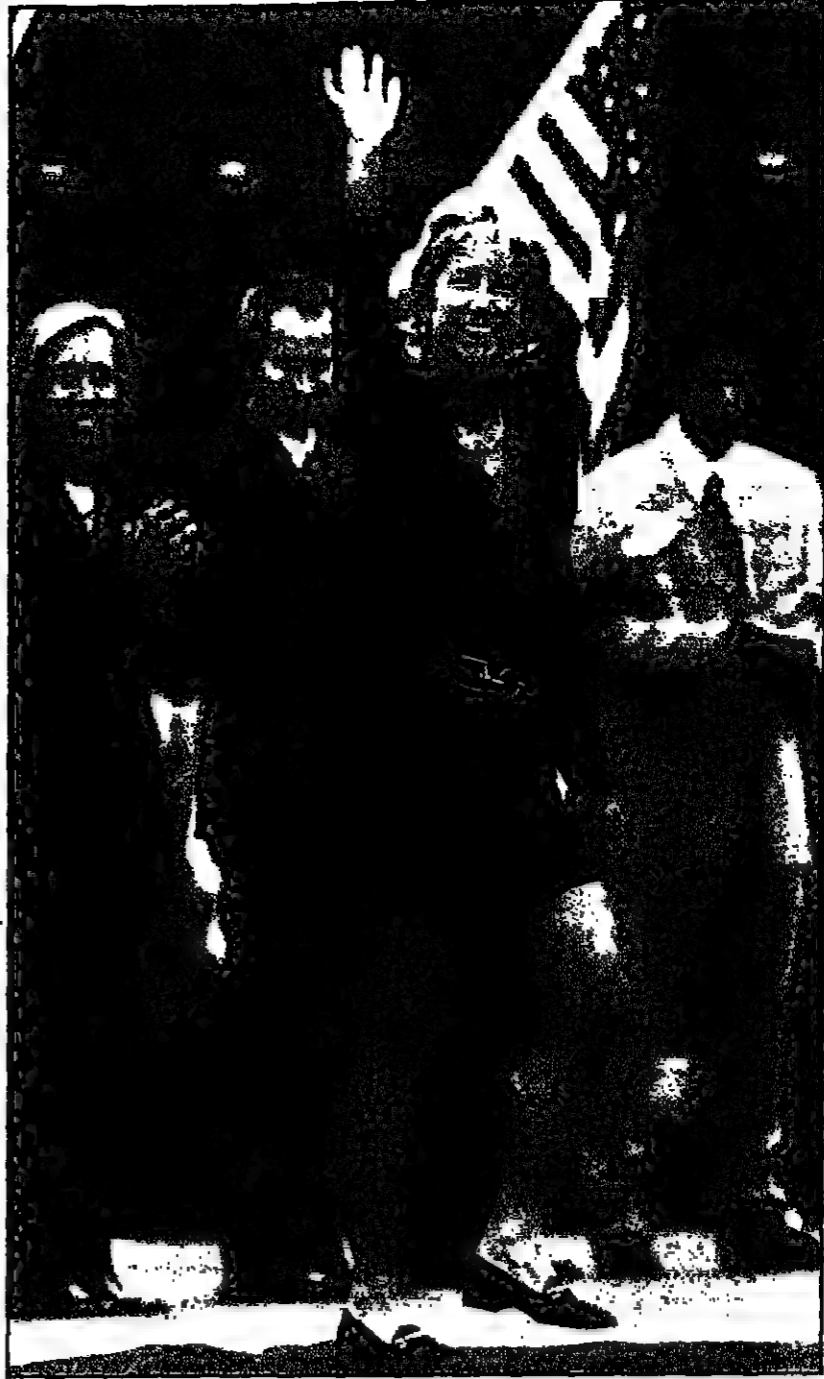
احتشد عدد من نجوم التنس العالميين السابقين في الاحتفال أمس ببدء دورة ويمبلدون في لندن... وفي الصورة تظهر كريس إيفرت وراقة يديها بالتمنية والي اليسار ماريتزا نافرا التوروا وجون ماكرو بينما يظهر البطل بت سامبراس في اليمين (رويترز)

على 857690 دولارا. وجاء الأمريكي مايكل تشانغ في المركز الثاني برصيد 855383 دولارا والبرازيلي جوستافو كوريتا في المركز الثالث برصيد 833021 دولارا. وحل الإسباني النيس كوريتا في المركز الرابع برصيد 811987 دولارا في حين جاء الهولندي يول هارمويين في المركز العشرين والأخير برصيد 426488 دولارا. وفي رتبة ماين (بولندا) فاز الهولندي ريتشارد كرايتشيك بلقب فريدي الرجال في بطولة ماينكس التنس التي تنظمها كل من رابطة لاعبي التنس المحترفين ورابطة لاعبي ألعاب التنس. وتخطى كرايتشيك المنصف الثالث في البطولة على الفرنسي غيوم روك في 7 و 6 في مباراة دامت 68 دقيقة. وهذه هي المرة الثانية التي يفوز فيها كرايتشيك بلقب البطولة وتصدر التماسوي توماس موستر قائمة الجوائز المالية التي أصدرتها رابطة لاعبي التنس المحترفين أمس الاثنين بحصوله